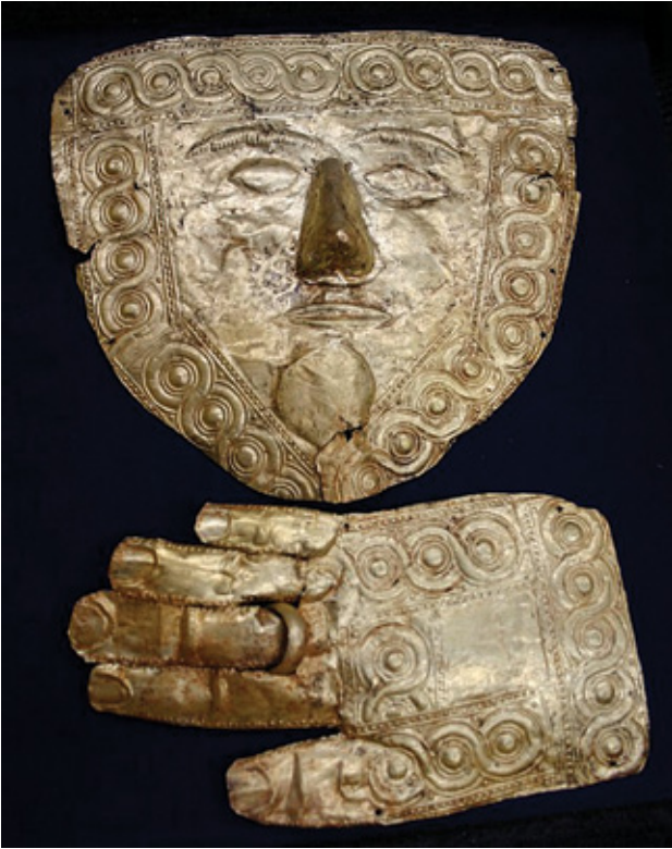
Слика 1. Златна погребна маска најдена под Самоиловата тврдина во Охрид