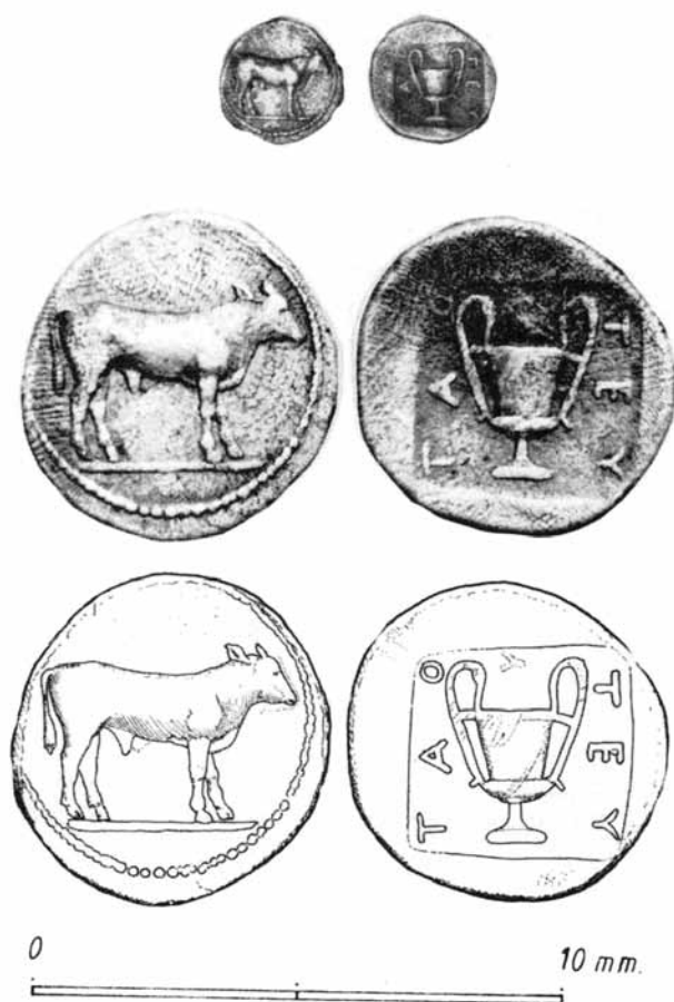
Слика 4. Сребрен диобол на Теутаос, најден на Маркова Кула, Корешница, кај Демир Капија.

мот е испишано името: ΤΕΥΤΑΟΣ. 11 На ова откритие не му е посветено соодветно внимание, а токму тоа може да биде крунски сведок за пајонска припадност на Охридскиот регион во архајскиот период. Не треба да се биде многу умен за да се заклучи дека ваков шлем морало да и припаѓа на исклучително важна, одн. значајна личност. Дека се работи за личност од пајонскиот естаблишмент, како доказ може да послужи монетата, сребрен диобол на Теутаос, откриена на Маркова Кула кај Корешница, Демир Капија. 12 На аверсната страна од монетата е прикажан млад бик во стоечка положба свртен надесно. На реверсот се наоѓа претстава на кантарос со високо издигнати рачки над ободот во вдлабнат квадрат. Оддесно налево се чита натпис ΤΕΥΤΑΟΣ(Σ), објаснет како име на пајонски владетел, одн. крал, кој се наоѓал на пајонскиот престол кон крајот на 5 век пред н.е. (Слика 4) Според типот на кантаросот монетата е датирана во третата четвртина на 5 век пред н.е. Извесни несогласувања во датирањето што се