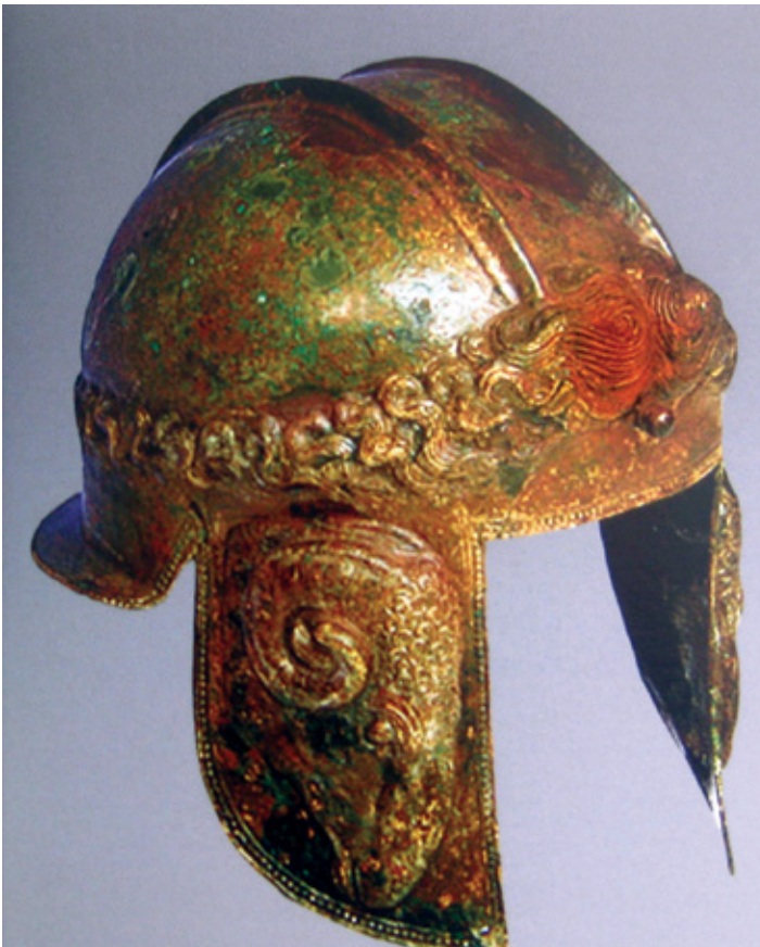
Слика 3. Бронзен шлем најден под Самоиловата тврдина во Охрид со испишано име: Ч Теутаос.

- Железен меч во гробот 194. Овој масивен меч потсетува на ваквите наоди откривани на пајонските некрополи во долното Повардарје, датирани во 7 век пред н.е.